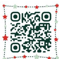
กรอกใบสมัคร

Google Form สำหรับการรับสมัครบุคคลเพื่อคัดเลือกปฏิบัติหน้าที่ ลูกจ้างชั่วคราวผ่านระบบออนไลน์ (แสดกน QR Code) ดังนี้