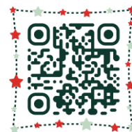
แนบหลักฐานการจ่ายค่าธรรมเนียม