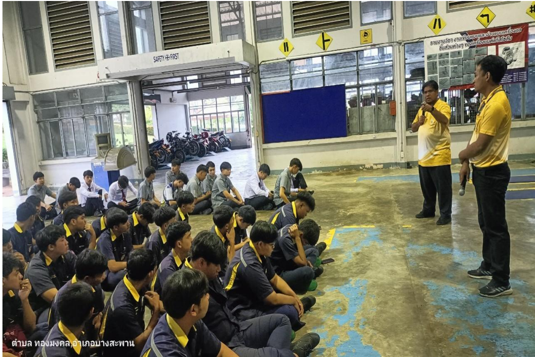
ตำบล ทองมั่งคณ,อำเภอบางสะพาน

เอกสารที่แนบไว้ http://rms.bspc.ac.th/files/96862_25021618185420.jpg