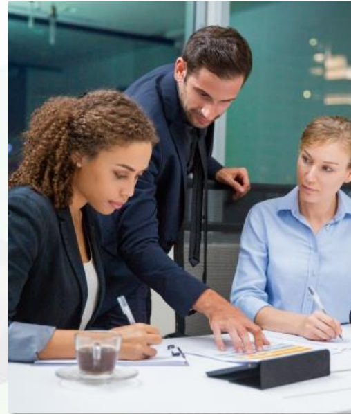
R&D manager (ผู้จัดการฝ่ายวิจัยและพัฒนา)