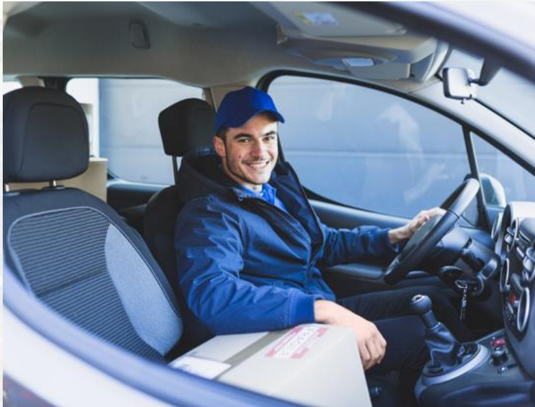
Distribution manager (ผู้จัดการฝ่ายจัดส่งสินค้า)