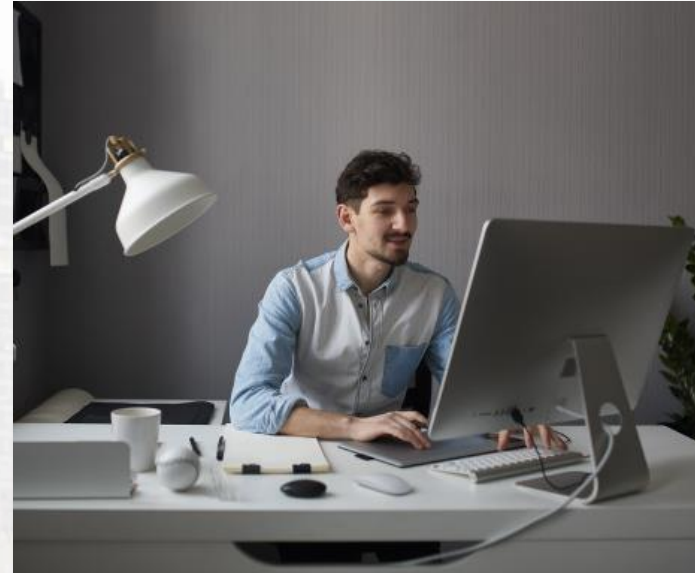
Advertising manager (ผู้จัดการฝ่ายโฆษณา)