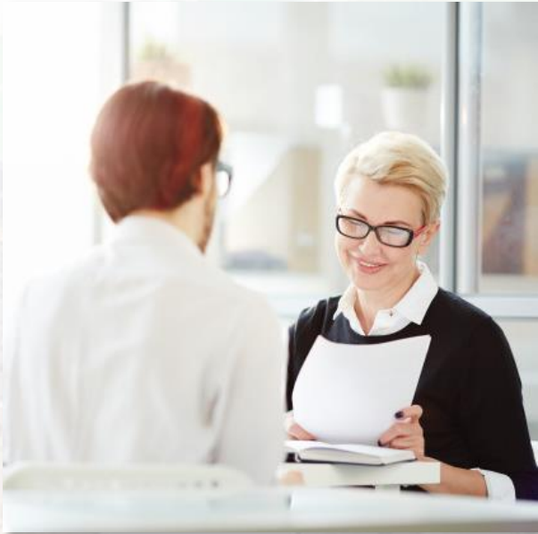
HR manager (ผู้จัดการฝ่ายบุคคล)