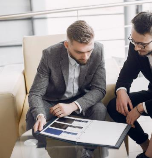
Purchasing manager (ผู้จัดการฝ่ายจัดซื้อ)