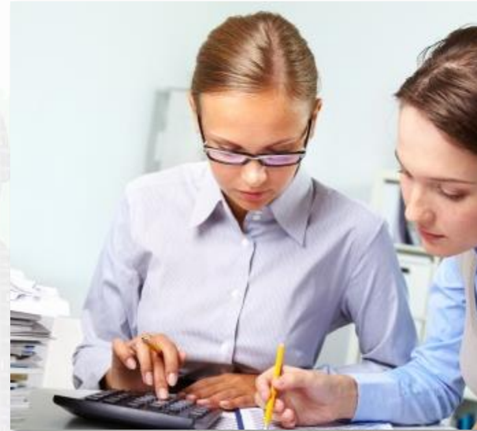
Accounting manager (ผู้จัดการฝ่ายบัญชี)