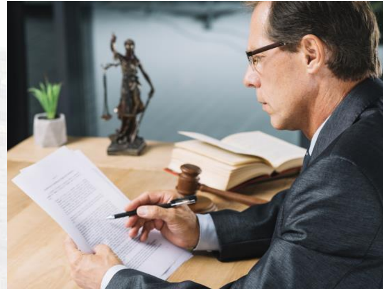
Legal manager (ผู้จัดการฝ่ายกฎหมาย)