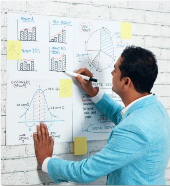
Marketing manager (ผู้จัดการฝ่ายการตลาด)